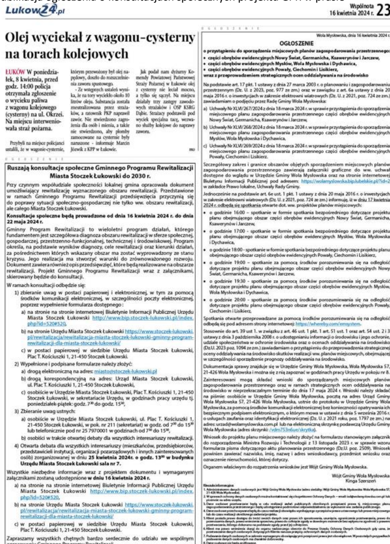
Rysunek 1 Publikacja ogłoszenia o konsultacjach społecznych projektu GPR w prasie